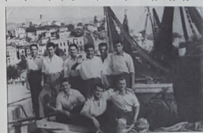
Νέοι ψαράδες, Τσομελιήδες κ.ά., περ. 1950.

Εβδομήντα χρόνια ήταν αυτά και δεν ξεχνιούνται. Εβδομήντα χρόνια από τη Μικρασιατική Καταστροφή και την άφιξη των προσφύγων ψαράδων από τη Μικρασία και τη Θράκη , το Μαρμαρά , το Αιβαλί , το Τοσεμί , τ' Αλάτσοπα , τα Βουρλά , τη Μυτιλήνη , τη Χίο , τη Λήμνο , τη Σάμο , που έστησαν τα όμορφα και γραφικά ψαράδικα στην πιο ωραία γωνιά της Καβάλας. Τα μαγαζάκια αυτά, όσα ήταν εκτός Λιμεναρχείου, με την πάροδο του χρόνου γκεμιώθηκαν και στη θέση τους φώτρωσαν πολυτελείς καφετέριες, αναψυκτήρια και ταβερνάκια. Όσα βρισκόταν κάτω απ' το Λιμενικό Ταμείο, ούσθηκαν αλλά τα περισσότερα έγιναν μαγαζάκια με είδη λαϊκής τέχνης.